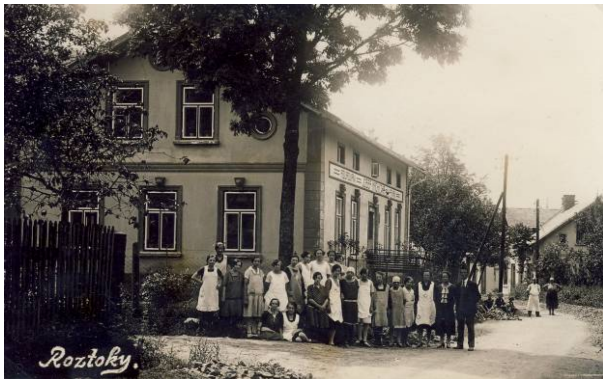
Foto 1935, před rekonstrukcí silnice