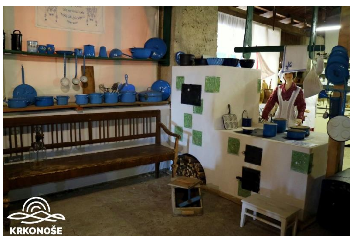
Rokytnice nad Jizerou Starý Kravín